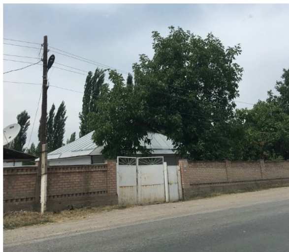
Зал Царства в селе Абдраимова. Июль 2020 года

металлическая крыша и ореховые деревья, которые растут почти в каждом доме в селе.