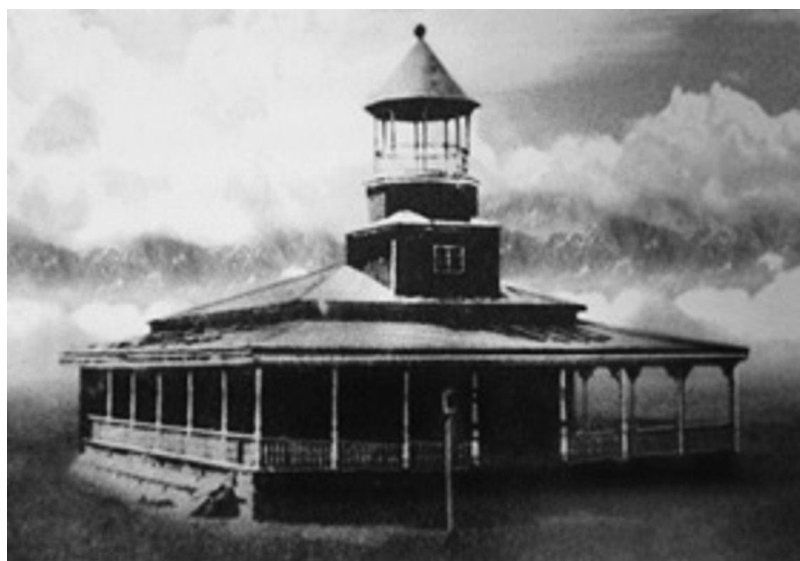
Медресе Шабдан Жантай уулу.