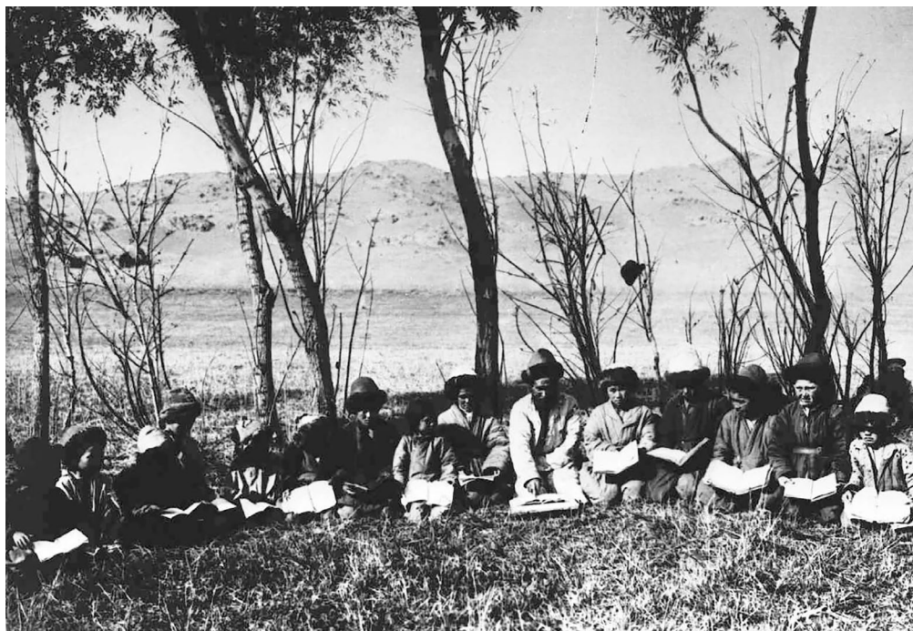
Учащиеся медресе (1910–1911 гг.)